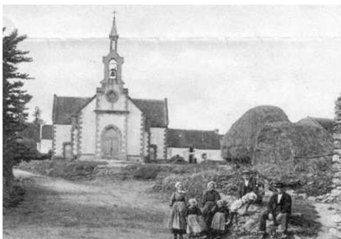
L'église de Penvins au temps d'Adrien Régent.

oratoire, mais sa chapelle, celle de son fief, était la chapelle de la côte. En 1630 un document décrit « L'île...de Penvins au fond de laquelle est bâtie le chapele dudit Penvins... » A l'époque on confondait les mots île et presqu'île . Cette chapelle « au fond de » la presqu'île de Penvins est tout simplement Notre-Dame de la côte.