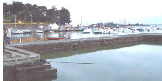
Port du Logeo

(réservations pour le repas à la Maison du Tourisme - St Colombier au 02 97 26 45 26 jusqu'au 30 juin inclus)