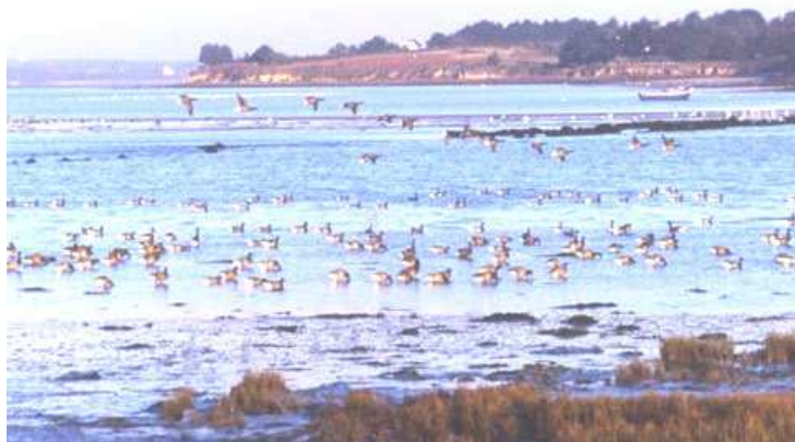
« Ambiance bernaches »

L'Anse de Kerbodec (500 m à droite avant l'arrivée à Sarzeau) : en automne-hiver, à mi-marée, excellent site pour observer les limicoles, les bernaches cravants ainsi que les canards de surface (siffleur et souchet notamment).