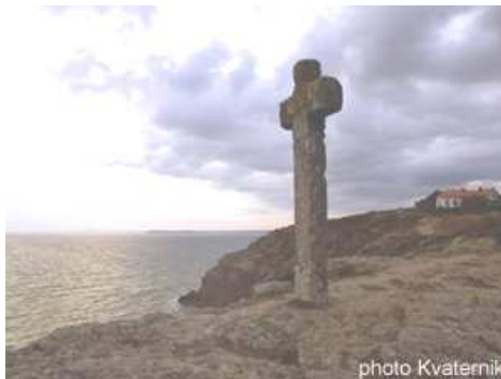
Pointe du Grand Mont

avoir longuement prié, il se résolut à passer à l'offensive. La bête était blottie au fond de son trou. Parvenu devant le monstre, il sortit de dessous son manteau une pelote de laine que traversaient des aiguilles. Le serpent ouvrit la gueule et tenta d'avalier la pelote. Mais, elle resta coincée dans sa gueule grâce aux aiguilles qui en dépassaient. Gildas qui n'avait pas lâché l'extrémité de la laine déroula alors une longueur suffisante de corde pour ne pas