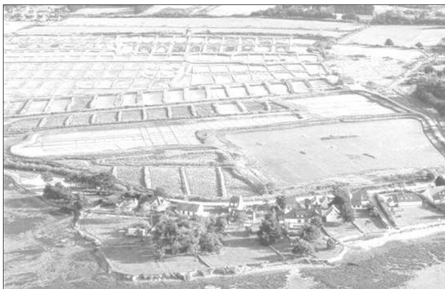
Photo des marais de Lasné à St Armel

Les marais salants ou salines sont des bassins creusés au bord de la mer, à même la terre du rivage, entourés de digues, partagés en compartiments et limités par des levées de terres et dans lesquels on laissait circuler l'eau de mer suivant un parcours déterminé pour lui faire abandonner le sel qu'il contient.